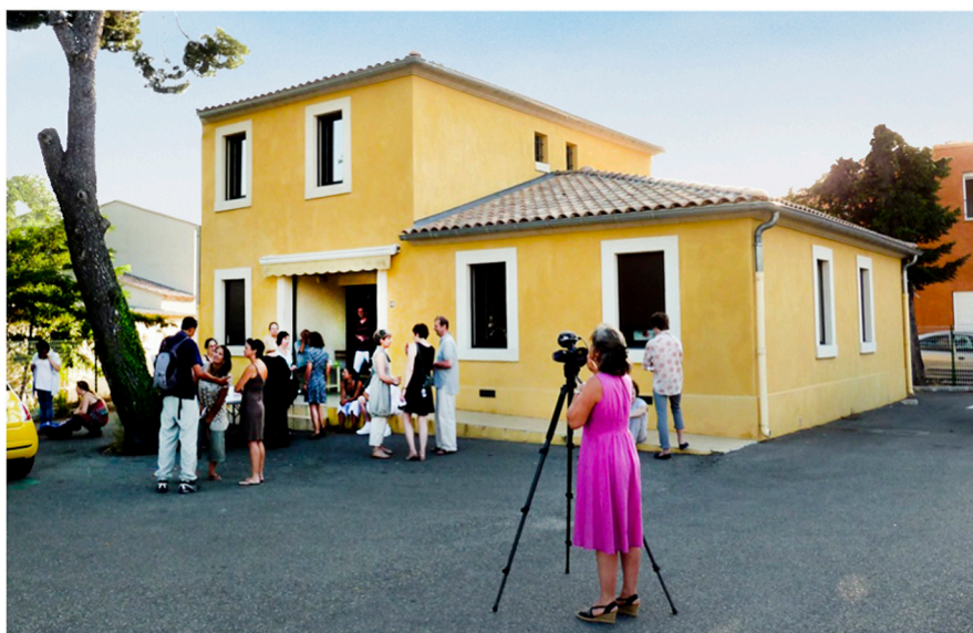
Marie Arnaudet de ArlesWeb-TV filmant le vernissage.